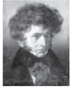
エクトル・ベルリオーズ (1803 - 1869)

1830年のフランス・パリ。そこでは、一人の若い作曲家の作品が人々を熱狂させていました。若い作曲家とは鬼才「ベルリオーズ」であり、作品とは「幻想交響曲」です。ベルリオーズは、「自身の失恋体験」という個人的な事作曲の素材に取り上げ、この交響曲を作曲しました。「気高く崇高な音楽」で隣国ドイツ中を熱狂させた楽聖ベートーヴェンが1827年にこの世を去ってからわずか3年後のことです。ベルリオーズは、この曲で、舞台袖での演奏を導入し、演劇的、立体的演奏効果を上げるとともに、管弦楽の規模も、当時の標準から大幅に増大させ、ベートーヴェンが交響曲に導入したピッコロやトロンボーンはもちろん、イングリッシュホルン、コルネット、オフィクレイド（現在のチューバに相当）、ハープ、鐘、ずらりと並んだ打楽器群、と新しい楽器をふんだんに導入し、視覚的・音量的にも大迫力のサウンドを作り出したのです。