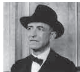
マヌエル・デ・ファリャ (1876～1946)

スペインにまつわるクラシック曲というと、何が思い浮かぶでしょう。ビゼーの「カルメン」、シャブリエやラヴェルの「スペイン狂詩曲」、リムスキー＝コルサコフの「スペイン奇想曲」等たくさんありますが、これらは外国の作曲家がスペインをテーマに作曲したものであり、「生粋のスペイン人」が作曲したクラシック音楽というと、そう多くはなく、本格的な大作作曲家の登場は、19世紀後半を待たねばなりません。そんな中のひとりがファリャであり、その代表作がバレエ音楽「三角帽子」です。題名の「三角帽子」とは、物語の悪役となる代官が、権威の象徴として被っている三本の角のある帽子の事を指します。スペインのアラルコンの同名の小説を原作にバレエ化したものです。振付は当時の花形ダンサーであるレオニード・マシーン、舞台装置と衣装を担当したのは、かの有名なピカソだったそうです。ファリャを含む一流の芸術家達によって上演されたこのバレエの初演は大成功でした。